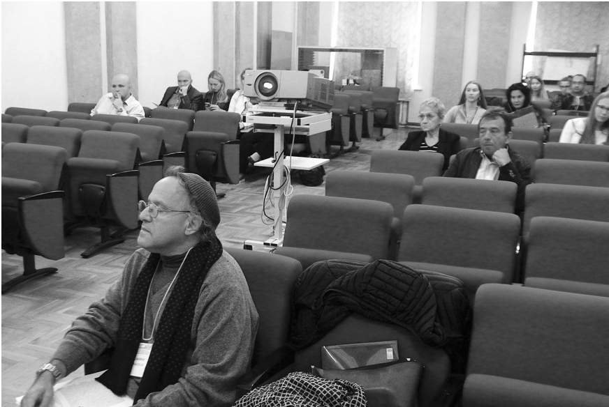
Илл. 2. Работа секции конференции в зале заседаний Института философии Санкт-Петербургского государственного университета, 4 сентября 2017 г.

ситет в Иерусалиме, Академия языка иврит (Израиль), Гарвардский университет (США), Институт языка имени Р. Ачаряна НАН РА (Армения), Институт славяноведения РАН и Российский государственный гуманитарный университет (Москва), Институт лингвистических исследований РАН (Санкт-Петербург), Университет Экс-Марсель (Франция), Ереванский государственный университет (Армения), Лейпцигский университет (Германия), Одесский национальный университет имени И. И. Мечникова (Украина), Музей-институт геноцида армян (Армения), Музей истории польских евреев «Полин» и Варшавский университет (Польша), Библиотека им. Вл. Медема (Франция) и другие.